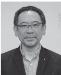
第2R第2Z ゾーンチェアパーソン