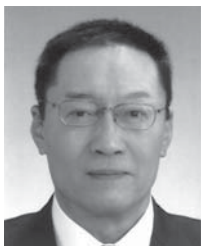
前地区ガバナー 地区名誉顧問会議長 長期計画リサーチ委員会副委員長