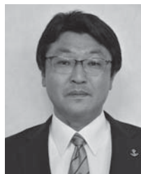
第4R第2Z ゾーンチェアパーソン