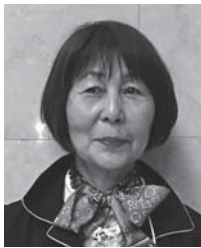
地区FWTコーディネーター