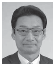
キャビネット幹事