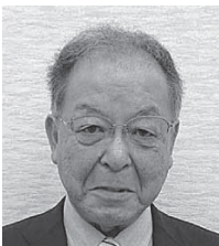
キャビネット運営委員会 委員長