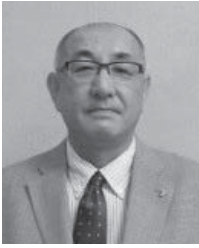
第2R第1Z ゾーンチェアパーソン