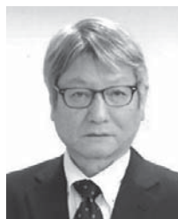
第5R第1Z ゾーンチェアパーソン

以上を目標に掲げたガバナー方針につきましては、当然各クラブのお力添えが不可欠につきクラブ訪問又は地区ガバナー諮問委員会等で力説して、まいりたいと、存じますので、地区の各コーディネーターの皆様方にも宜しくお願い申し上げます次第で御座います。