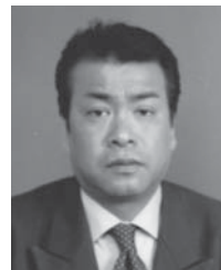
第3R第2Z ゾーンチェアパーソン

ガバナー諮問委員会や例会訪問などこれからZ内のクラブの皆様にお世話になりますがよろしくお願ひ申し上げます。