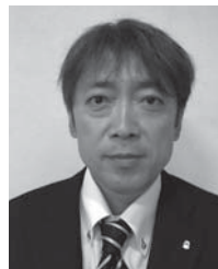
第1R第2Z ゾーンチェアパーソン

最期に各クラブ会員皆様のご協力、それからご指導、ご鞭撻をこの一年間どうぞよろしく願います。