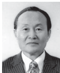
第2副地区ガバナー 長期計画リサーチ委員会副委員長

この1年、第1副地区ガバナーとして、邁進することをお誓いし、皆様のご協力をお願いし、就任の挨拶とさせていただきます。