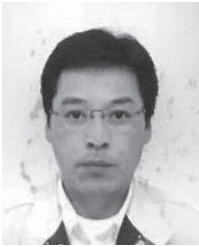
第5R第2Z ゾーンチェアパーソン

私自身の力量について、不安を持っておりますが、皆様のご支援を戴きながら努力をするつもりで有ります。1年間、宜しくお願い致します。