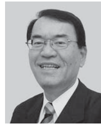
地区大会・国際大会 国際関係委員会委員長