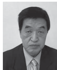
ライオンズクエスト 青少年指導・薬物乱用防止 委員会 委員長

このスローガンを実践するために、大会テーマはライオンズクラブの基本理念である「相互理解と友愛の精神」にしました。開催地木古内・知内は第1リジョン、第1ゾーンで初めて函館以外のローカル開催地であります。ホストクラブ11クラブ、令和元年ガバナー初めての大会として、すべてのホストクラブ、大会委員一同、一丸となってローカルならではの趣向を凝らした「手づくり感あふれる大会」を企画しておりますので2020年5月、たくさんの皆様にご参加いただけます事を期待しております。