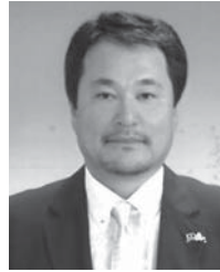
地区LCIFキャンペーン コーディネーター

以上の活動方針のもと、各クラブ、各リジョンFWTコーディネーターと知恵を出し合い、又家族会員・女性会員ライオネス・クラブエクステンション会員増強維持委員会委員長と連携をとりながら目標達成にむけて努力したいと考えておりますので、今期も皆様にご理解とご協力よろしくお願い致します。