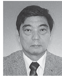
第3R第1Z ゾーンチェアパーソン

前期に2リジョン内11クラブで災害支援協定を結んだので、それに沿って災害に備えた準備やセミナーを進めます。