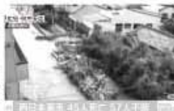
西日本豪雨被災地広島県広島市

我がクラブ、チャーターナイト51周年の記念事業として、西日本豪雨災害を受けた、グリーン盟友クラブへ義援金として送金。