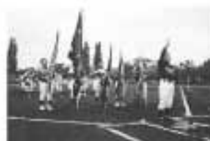
昔年優勝チームによる選手宣誓

各地域の野球少年団の小学生5年生までの男女に参加を載きまして、新人戦として対戦致しました。 低学年の参加もあり、父兄も大変応援に熱が入っておりました。 豚汁200食を提供させて頂きました。