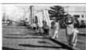
白老町「人と旗の波運動」交通安全運動呼び掛け

苫小牧警察署白老交番の協力を頂き、無事終了する事が出来ました。多くのご協力ありがとうございます。