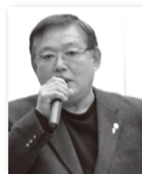
献血・献腎・献眼・糖尿病 保健委員会委員長

この惨状が各地で起こっています。これからも続けてライオンズの奉仕の力を発揮しなければならないのではないかとつくづく思いました。第2号発行に安堵する事なく、次回の発行に向けて委員一同頑張っていきますので、皆様のご協力をお願い申し上げます。