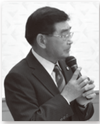
ライオンズクエスト 委員会委員長