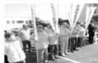
「人と旗の波」交通安全運動