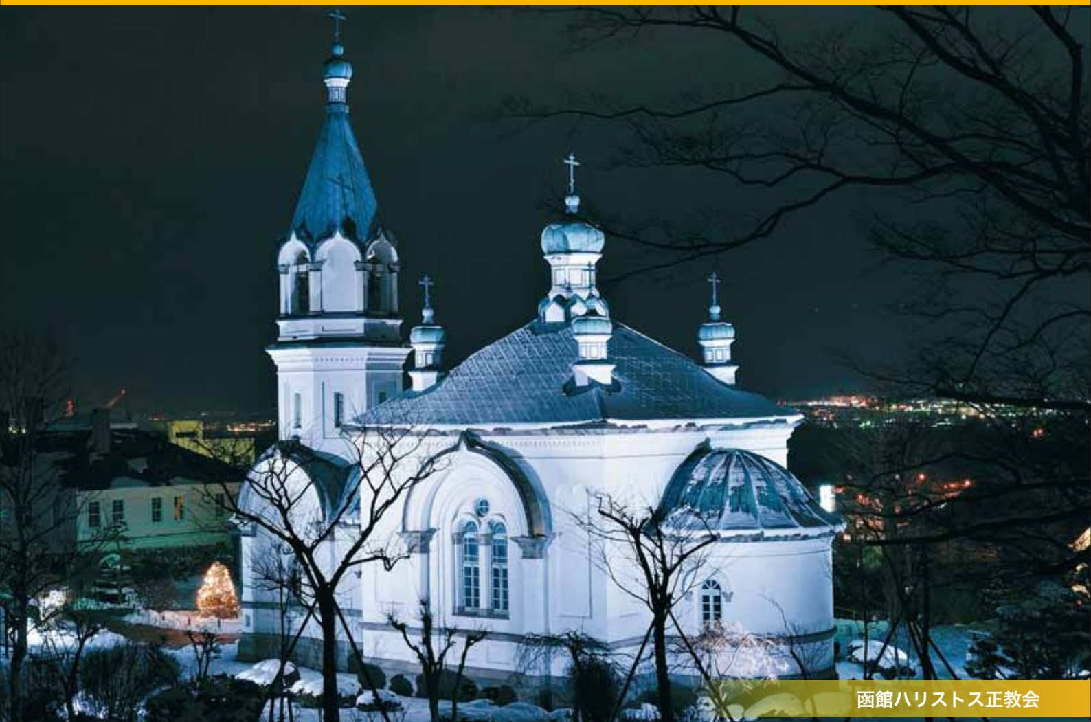
函館ハリストス正教会