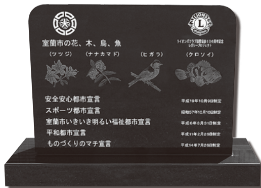
贈呈場所 「室蘭市市民会館」 石碑