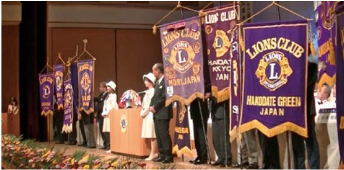
次期キャビネット