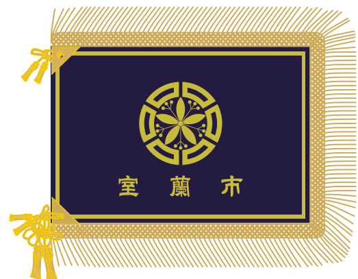
贈呈場所 「室蘭市 市役所」 市旗