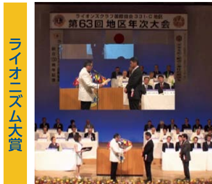
ライオンズム大賞