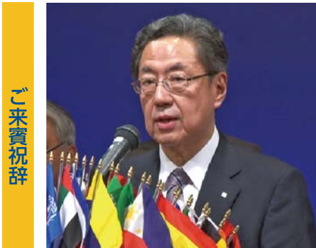
北海道知事 高橋はるみ 様 (代読)