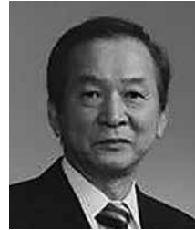
キャビネットの運営にご協力を

ホームページに関しましてはより便利に見やすく制作をしたいと思っておりますのでよろしくお願い致します。