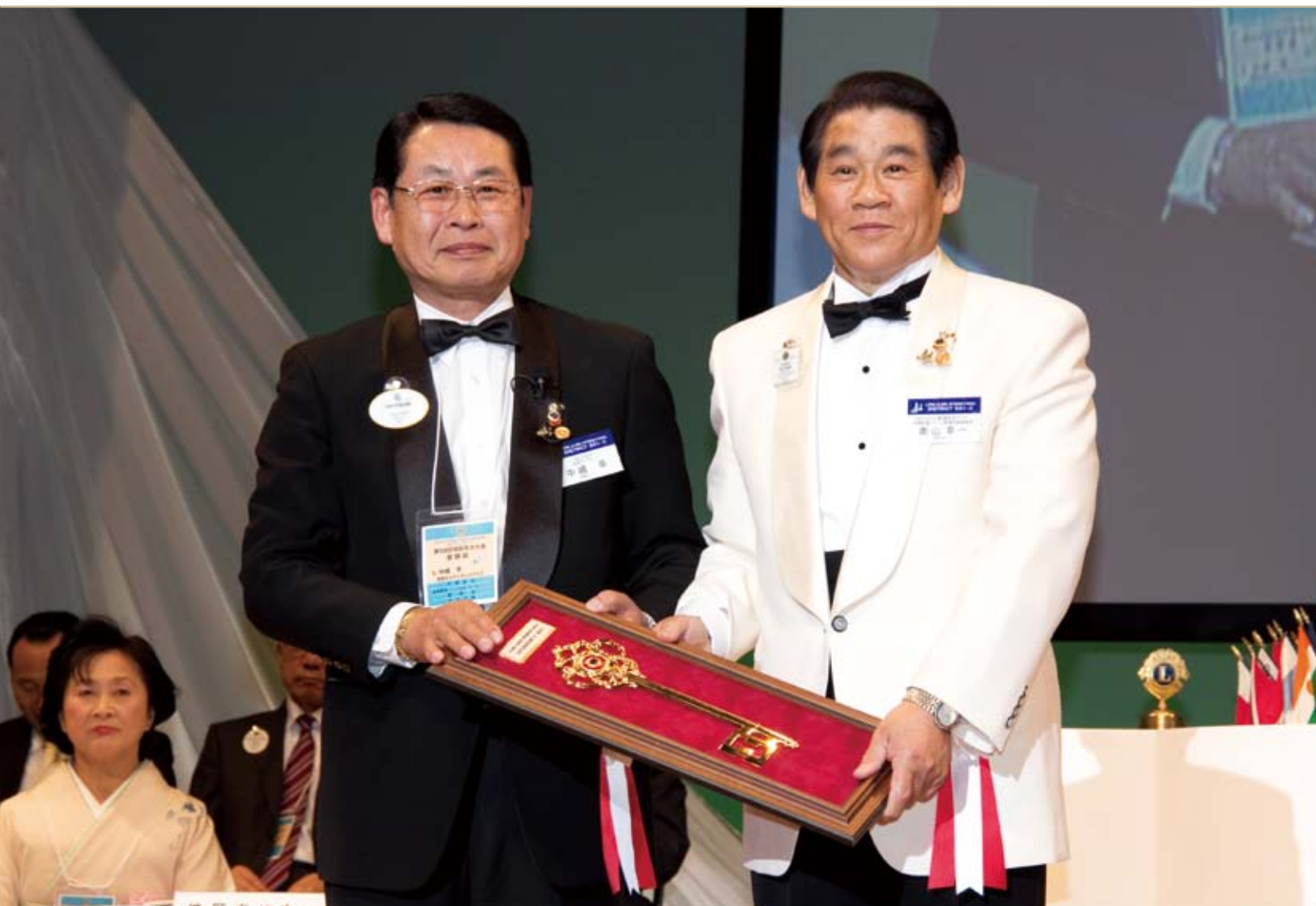
「ガバナーキー」室蘭から函館へ