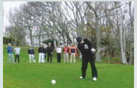
■ 室蘭ゴルフ倶楽部