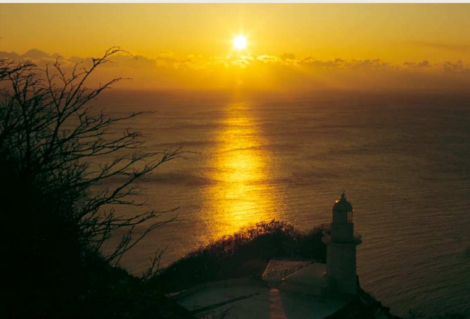
地球岬の初日の出