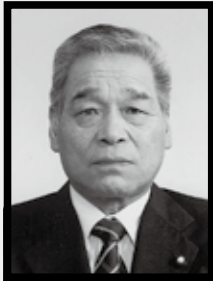
故 L水 野 進 今金 L C

1974~1975 幹事 1979~1980 会長 1982~1983 Z C P 1988~1989 会計 1994~1995 会長