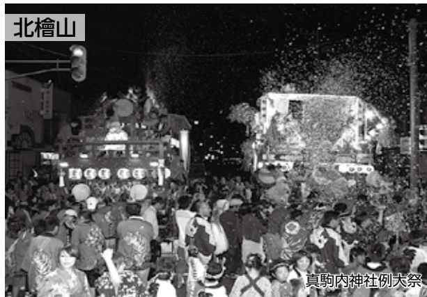
真駒内神社例大祭