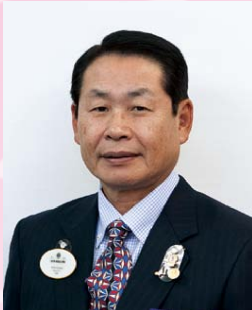
ライオンズクラブ 331-C地区ガバナー