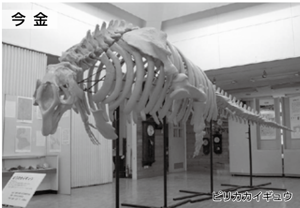
ピリカカイギョウ