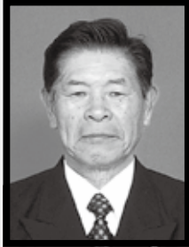
故 L石 井 一 義 厚真 L C