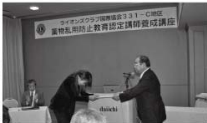
ライオンズクラブ国際協会331-C地区 薬物乱用防止教育認定講師養成講座